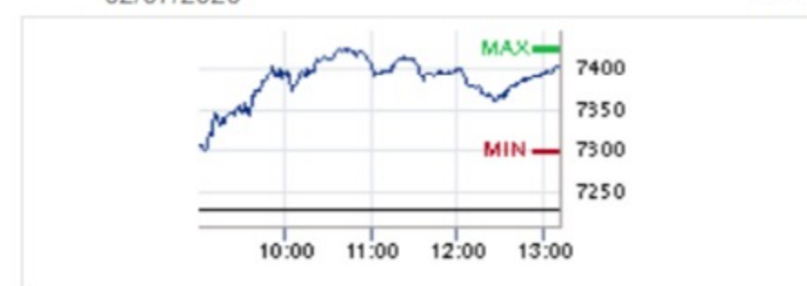
Cotización IBEX 35